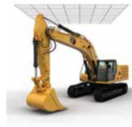
LÍMITE DEL TECHO