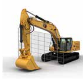
LÍMITE DE PARED DE PROTECCIÓN DE LA CABINA