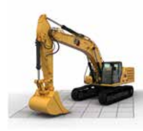
LÍMITE DEL PISO