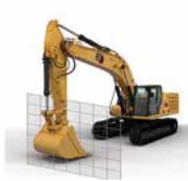
LÍMITE DE PARED DE AVANCE