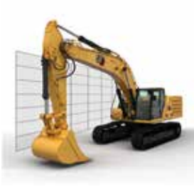
LÍMITE DE PARED DE OSCILACIÓN